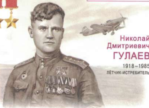
Николай Дмитриевич ГУЛАЕВ 1918–1985 ЛЁТЧИК-ИСТРЕБИТЕЛЬ